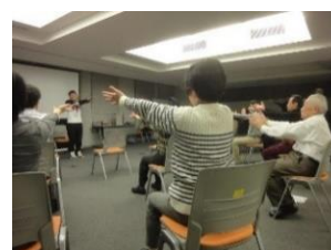
さあ、やってみましょう