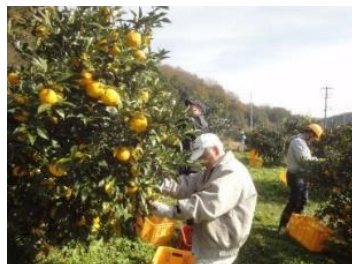
真剣に柚子もぎ応援