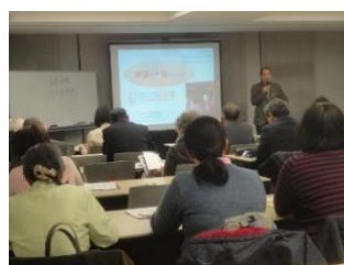
日本の神楽の歴史とは