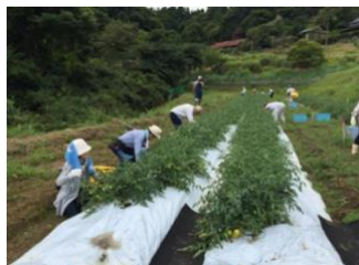
完熟トマト収穫風景