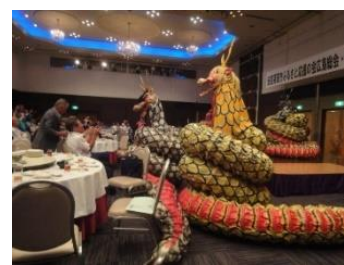
羽佐竹神楽団の熱演