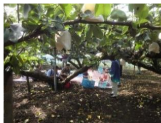
梨狩りで秋の味覚を満喫する