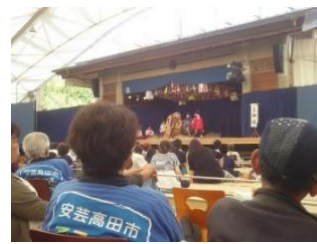
神楽ドームで神楽を楽しむ