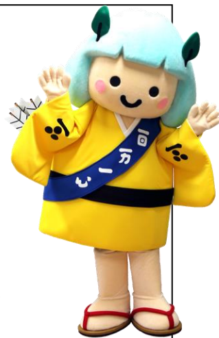
安芸高田市公式マスコットキャラクター