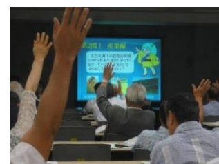
熱心に受講しています