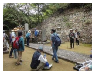
史跡めぐりで説明を聞く