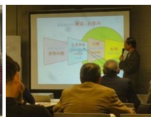
安芸高田市の神楽とは