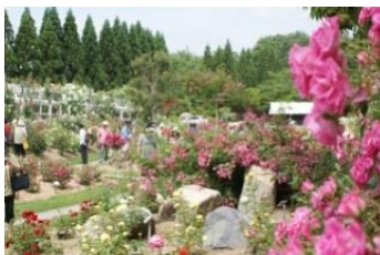
湧永庭園のバラ園