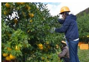
柚子もぎ作業 作業